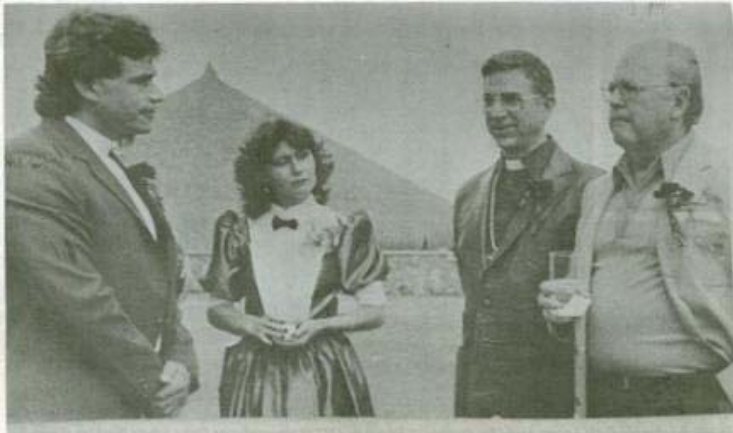
El día de la inauguración de La Posada Alemana, en el Quindío, Carlos Lehder logró alta bendición católica para sus dineros.

Fotografía durante la inauguración de la Posada Alemana. De izquierda a derecha: Primero: Carlos Lehder Rivas; tercero: Monseñor Darío Castrillón