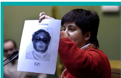
Momento captado en el Parlamento de Gasteiz.

El Parlamento de Gasteiz, con los votos de PNV, Ezker Abertzalea, EA y Aralar, aprobó una proposición no de ley en la que insta al Gobierno español a derogar la Ley Antiterrorista y a eliminar el régimen de incomunicación y la Audiencia Nacional. La Cámara, que expresó su solidaridad con todos los torturados, indicó que el tribunal especial «no hace efectivas las garantías procesales», al tiempo que reclamó a Madrid el «reconocimiento político de la existencia de torturas». Esta iniciativa legislativa, tramitada con carácter de urgencia, tiene su origen en el juicio que se celebrará en la Audiencia Nacional española contra trece vecinos de Gasteiz. Precisamente, en presencia de varios de los procesados en este sumario, la Cámara exigió también la desaparición de la Audiencia Nacional, un «tribunal especial, que no hace efectivas las garantías procesales, especialmente cuando se admiten declaraciones obtenidas bajo torturas y se aplica la denominada justicia del enemigo».